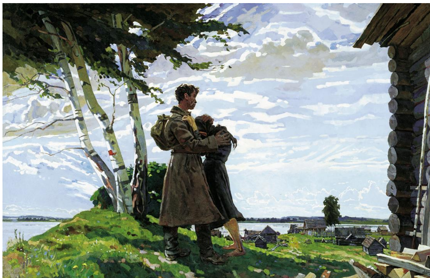
А. ГОРСКИЙ "БЕЗ ВЕСТИ ПРОПАВШИЙ"