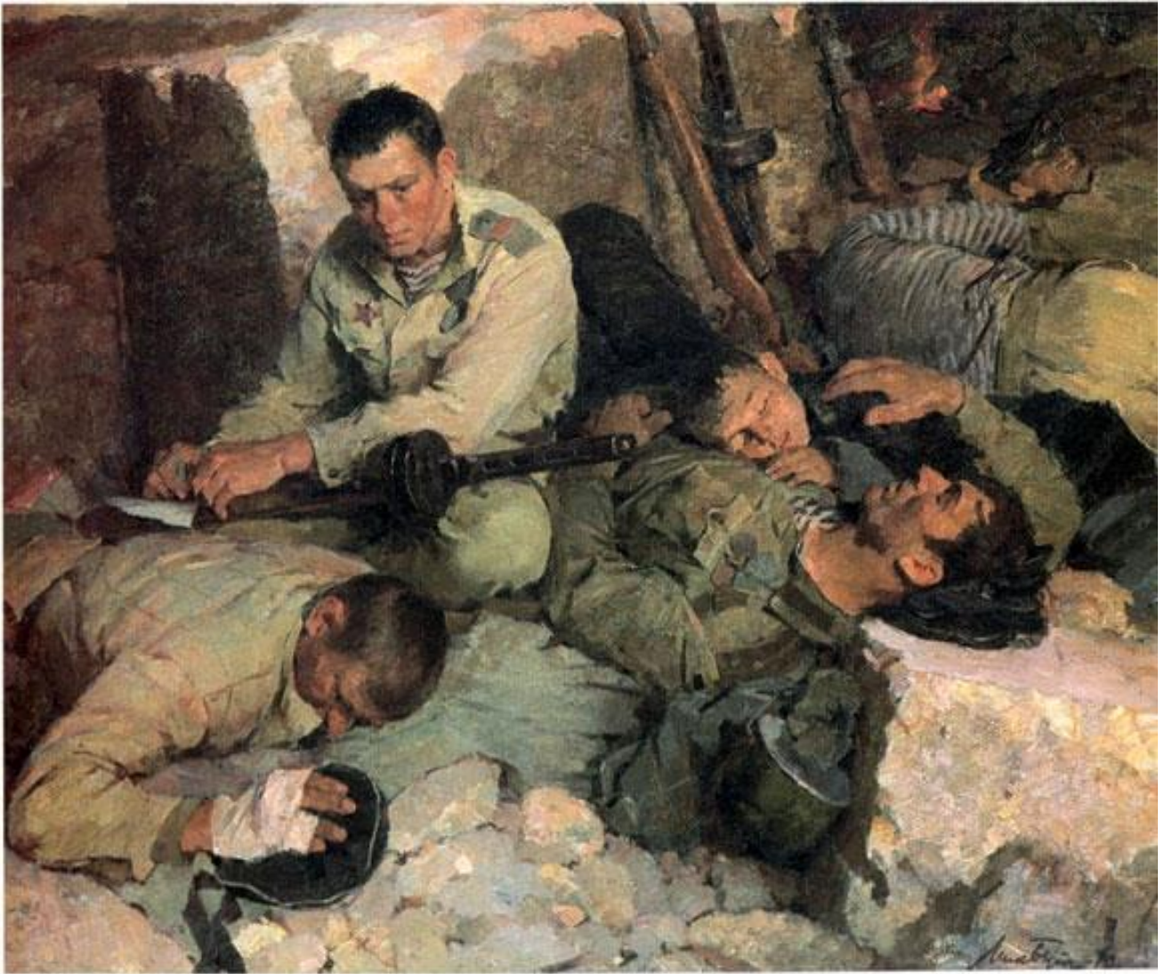
Н. БУТ "ПИСЬМО МАМЕ"