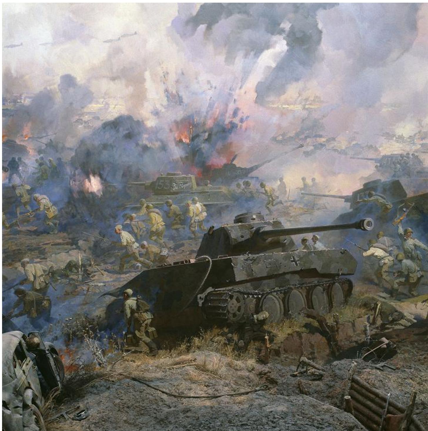
Огненная дуга 1