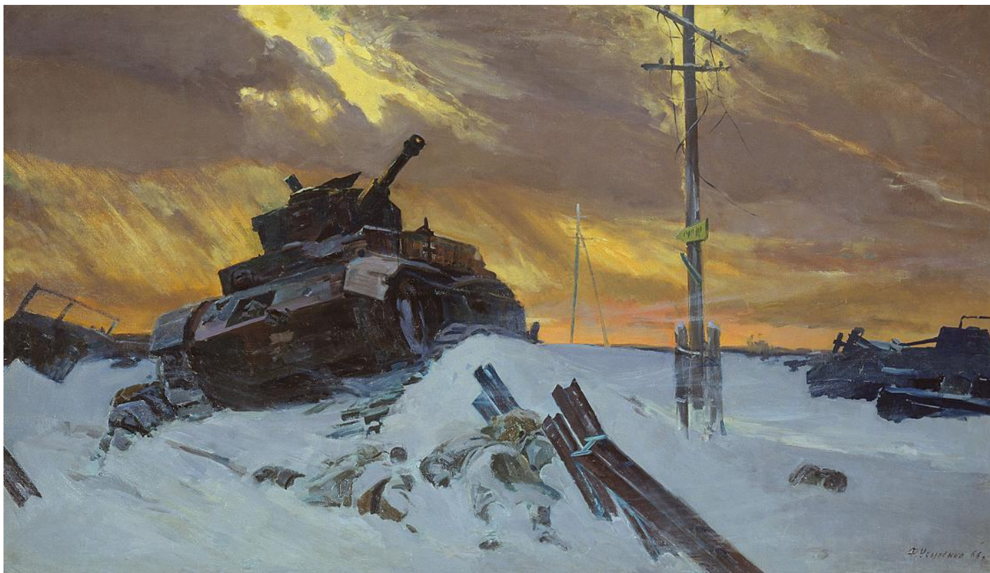
Ф. УСЫПЕНКО "ВРАГ ОСТАНОВЛЕН"