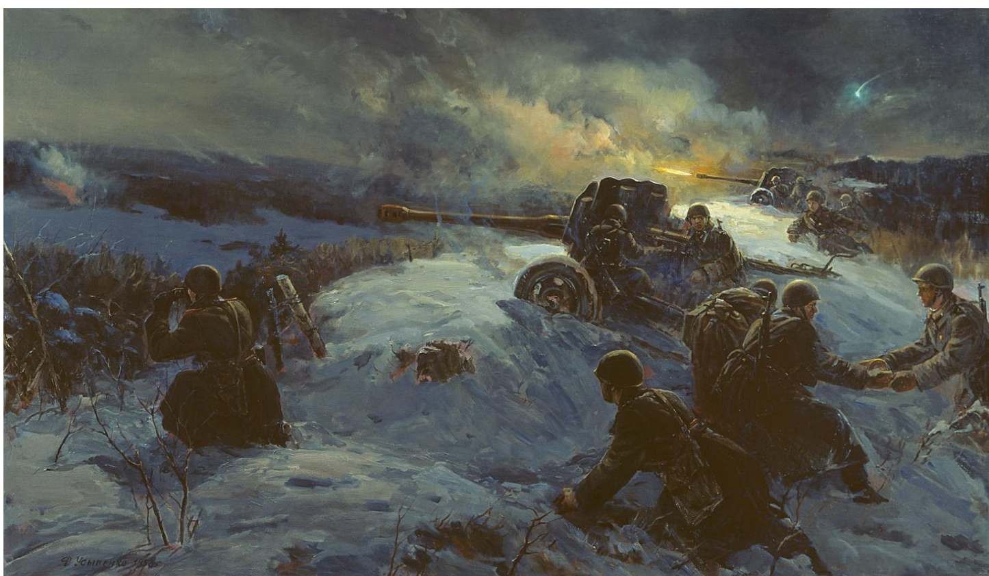
Ф, УСЫПЕНКО "НОЧНОЙ БОЙ"