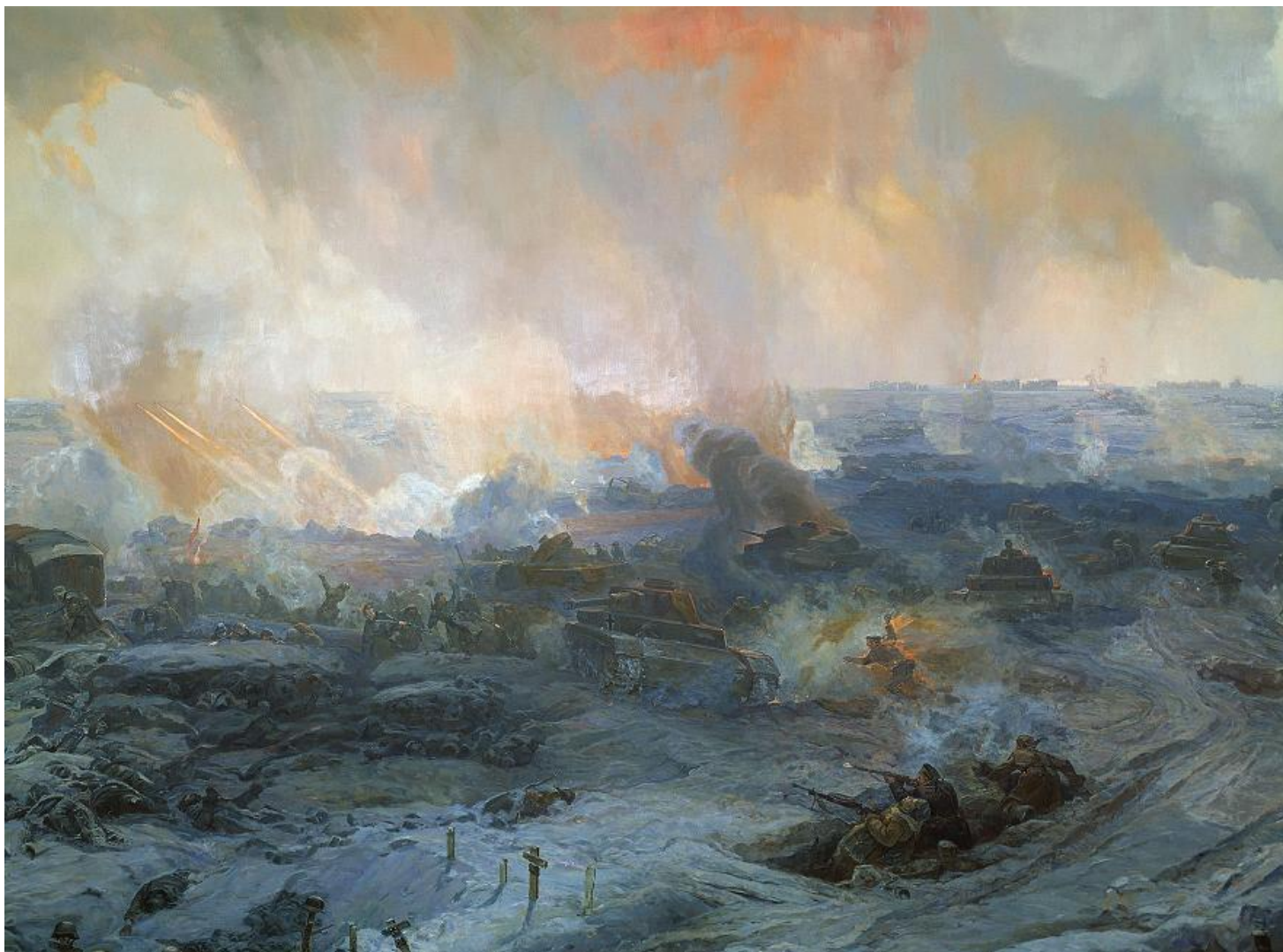
Огненная дуга 2