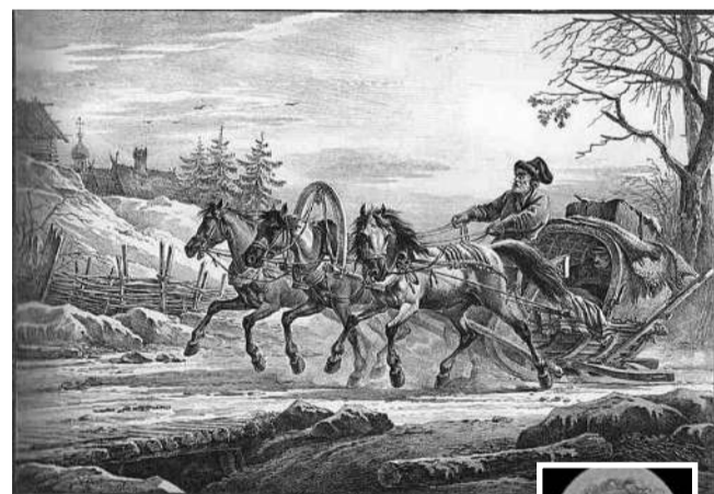
Настоящая кибитка — это крытая повозка, как на этой литографии Александра Орловского «Путешественник в кибитке, или Сани, запряжённые тройкой» (1819, Киевская картинная галерея)

Другие ученики назвали кибитку «птичкой», летящей с Кубы и крыльями поднимающей снег; «поездом, который очень быстро едет, и поэтому снег летит вверх и вниз» и даже «кибернетической, шустрой тёткой». Ямщик, по их мнению, оказался «дядей, профессия которого — таскать ящики»; человеком, роющим ямы, вероятно, карликом, «потому что сидит на чём-то маленьком и прячется в ямку».