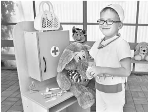
В «Ветклинике» дошколята печат плюшевых зверей