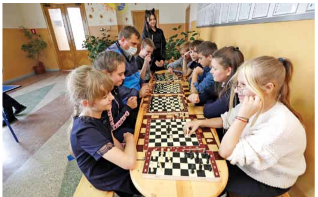
Шахматная зона в Ивнянской школе № 1