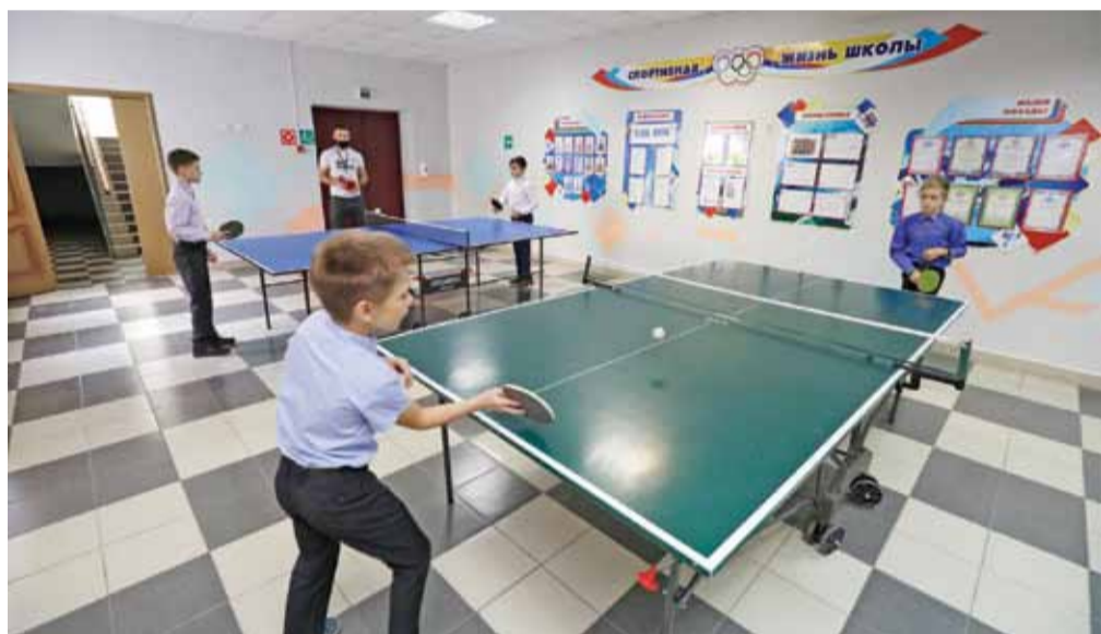
В настольный теннис в Верхопенской школе с удовольствием играют и дети, и взрослые