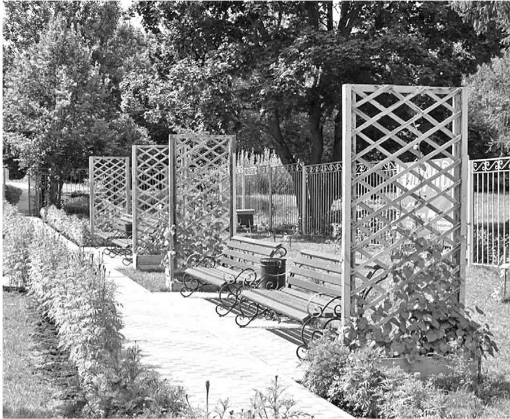
Вислудубравская школа Губкинского горокруга