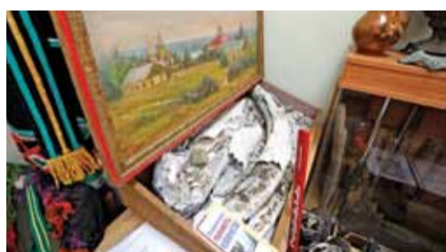
Гордость музея Курасовской школы — настоящий бивень мамонта!