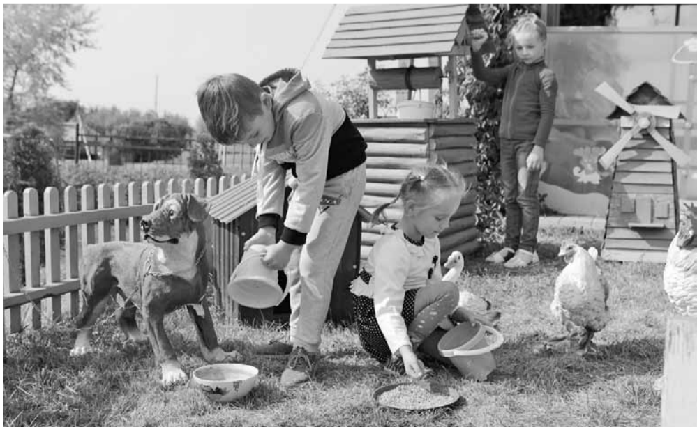
На «Фермерском дворике»

Ольга МУШТАЕВА » ТЕКСТ