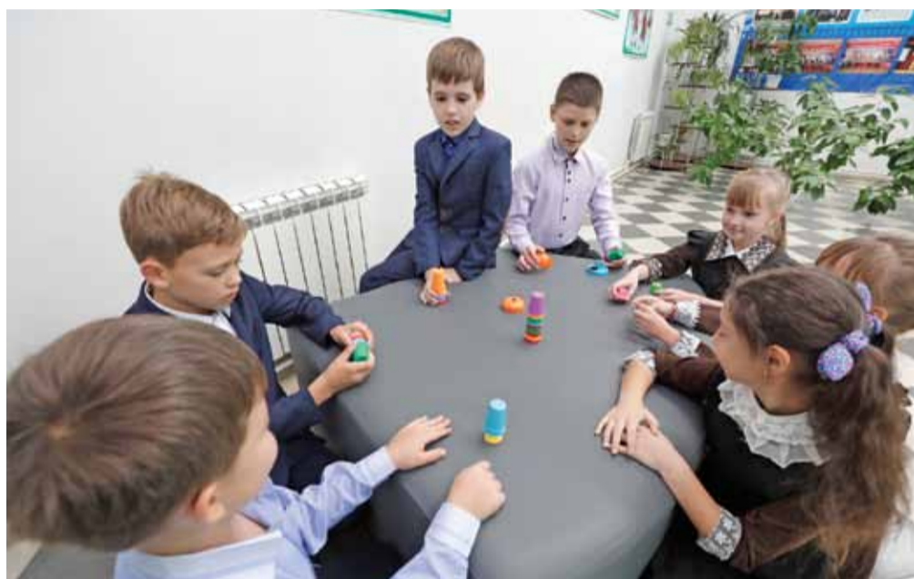
В художественно-эстетической зоне Верхоненской школы можно и проводить занятия, и играть