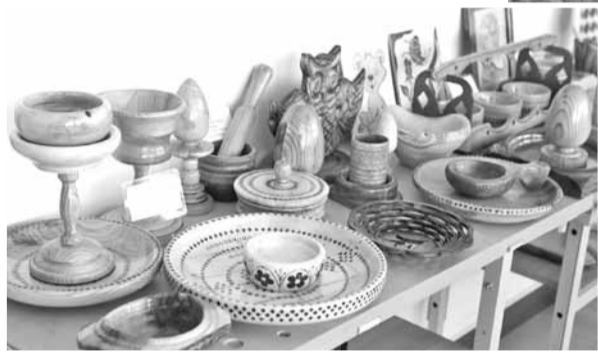
Изделия из дерева, сделанные школьниками на уроках технологии