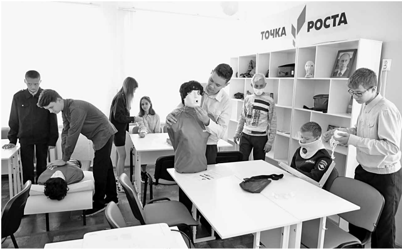
Занятия по оказанию первой медицинской помощи

Конечно, «Точкой роста» сейчас никого не удивишь. В Белгородской области уже привыкли, что даже небольшие сельские школы постепенно оснащаются современным оборудованием, а ребята учатся программировать, конструировать, управлять квадрокоптерами и легко осваивают цифровую технику.