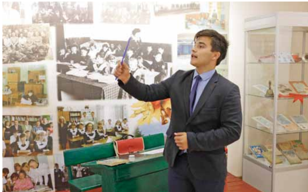
В музее Владимировской школы