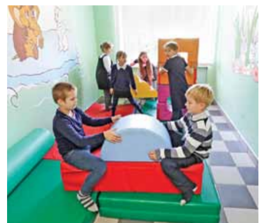
Игровая зона для младшеклассников в Курасовской школе

Сельские школы Белгородской области доказали: даже в маленькой школе можно так организовать учебно-воспитательный процесс, что ученики городских школ будут завидовать сверстникам из маленьких населённых пунктов. Смотрите сами: в сельских школах больше пространства, которое можно использовать для развития детей. У них и территория побольше, чем у городских, — значит, можно не просто газоны, а целые парки и дендрарии обустроить. Не говоря уже об опытных участках. Оснащаются многие сельские школы на самом высоком уровне, потому что участвуют во многих федеральных и региональных проектах. И учителя в небольших школах работают опытные и доброжелательные. Так что уже можно начинать завидовать школьникам из сёл и посёлков.