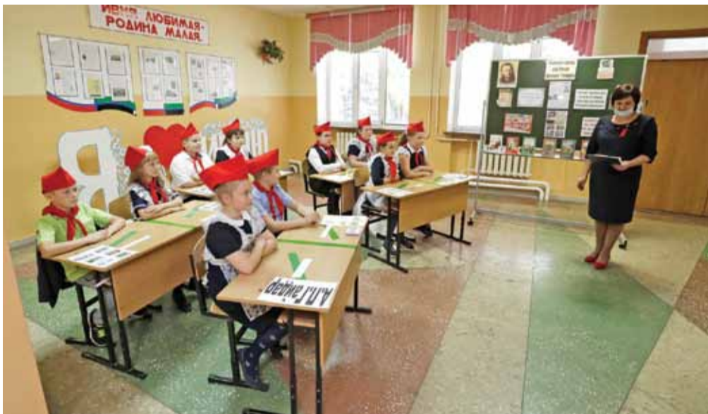
Занятие, посвящённое творчеству Аркадия Гайдара, во время внеурочной деятельности в Ивнянской школе № 1

Елена МЕЛЬНИКОВА » ТЕКСТ