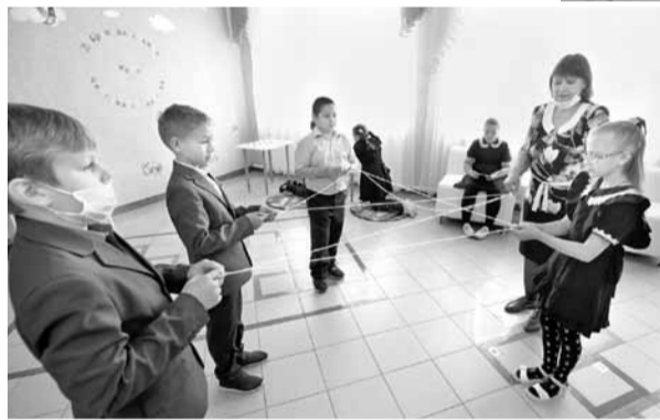
Четвероклассники играют в «Паутинку добра»