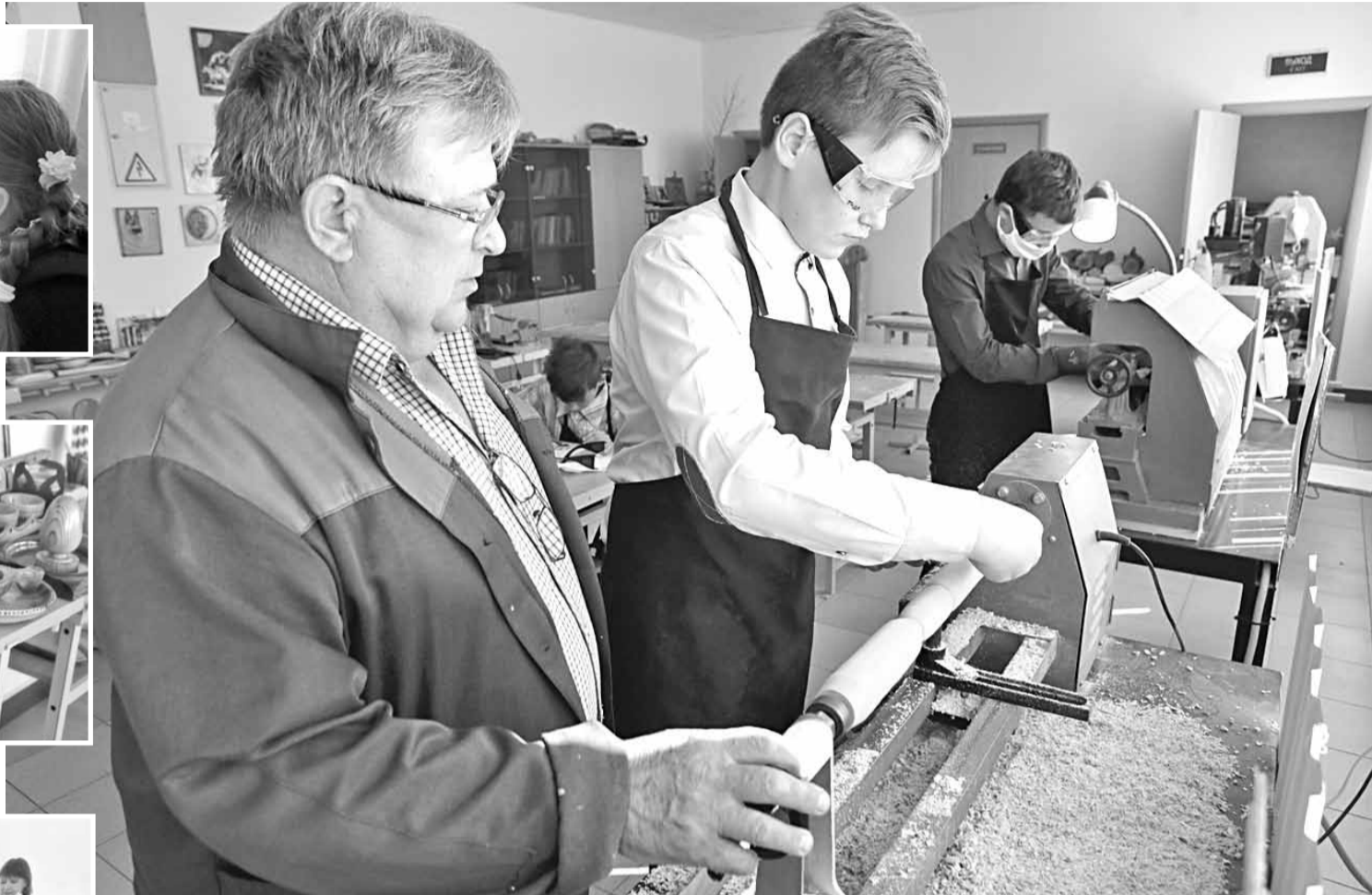
На уроке технологии в школьной мастерской

— С пятого класса я веду у ребят технологию, начинаем с самого простого — строгания древесины. После дерева постепенно переходим к работе