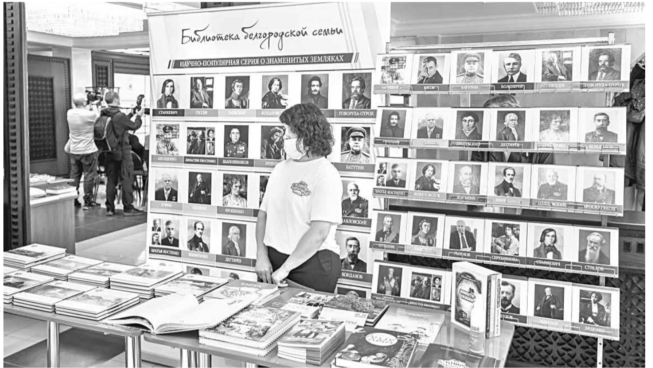
В последние годы в Белгородской области выпускается много качественных краеведческих книг, которые тоже можно изучать на уроках родной литературы

Задача нового предмета — познакомить школьников с произведениями фольклора, русской классики и современной литературы, которые не входят в список обязательных произведений, представленных в программе по предмету «Литература», но при этом максимально ярко воплотили национальную специфику русской литературы и культуры.