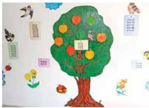
Владимировская школа. Стены тоже помогают учиться!

В кабинете логопеда — мультимедийный коррекционно-развивающий комплекс «Живой звук». Он очень полезен для ребят, которые плохо слышат и говорят. Упражнения с использованием «Живого звука» помогают исправить нарушения речи, развивают слуховую память, произношение, навыки связной речи и общения, память, мышление и т.д.