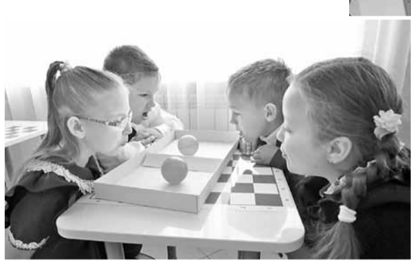
Дыхательная гимнастика на интерактивной переменной