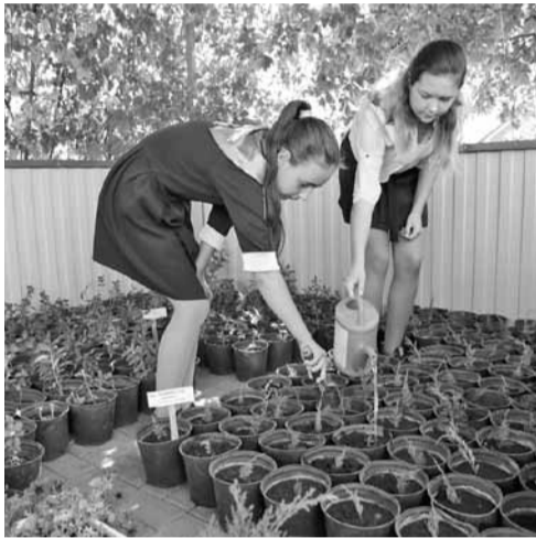
В школе выращивают растения с закрытой корневой системой