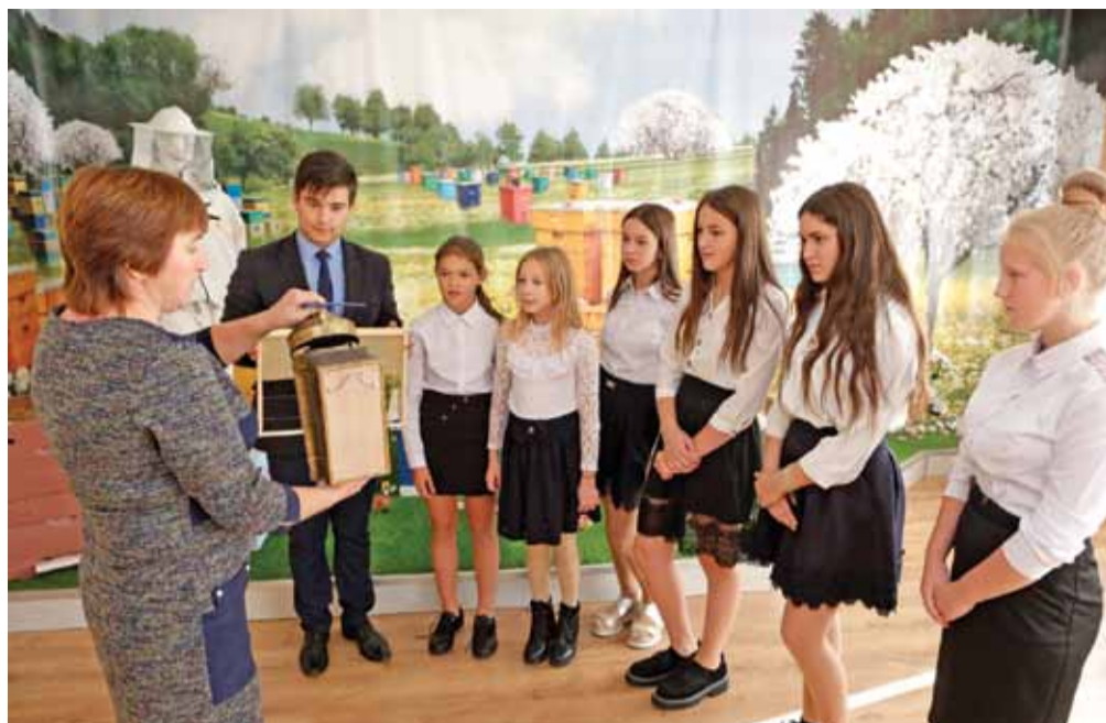
В музее мёда Владимировской школы