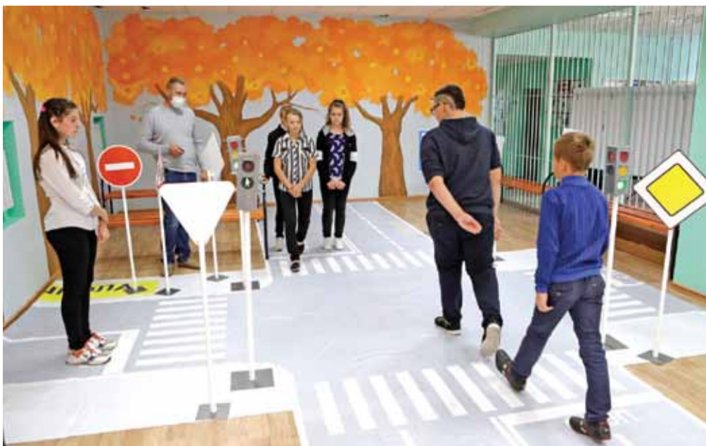
Интерактивная площадка для изучения Правил дорожного движения в Курасовской школе