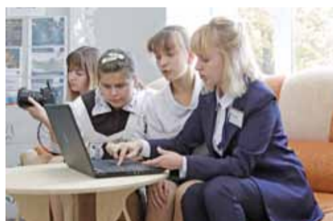
В Курасовской школе работает кружок «Юный блоггер», ребята публикуют новости школы в Инстаграме