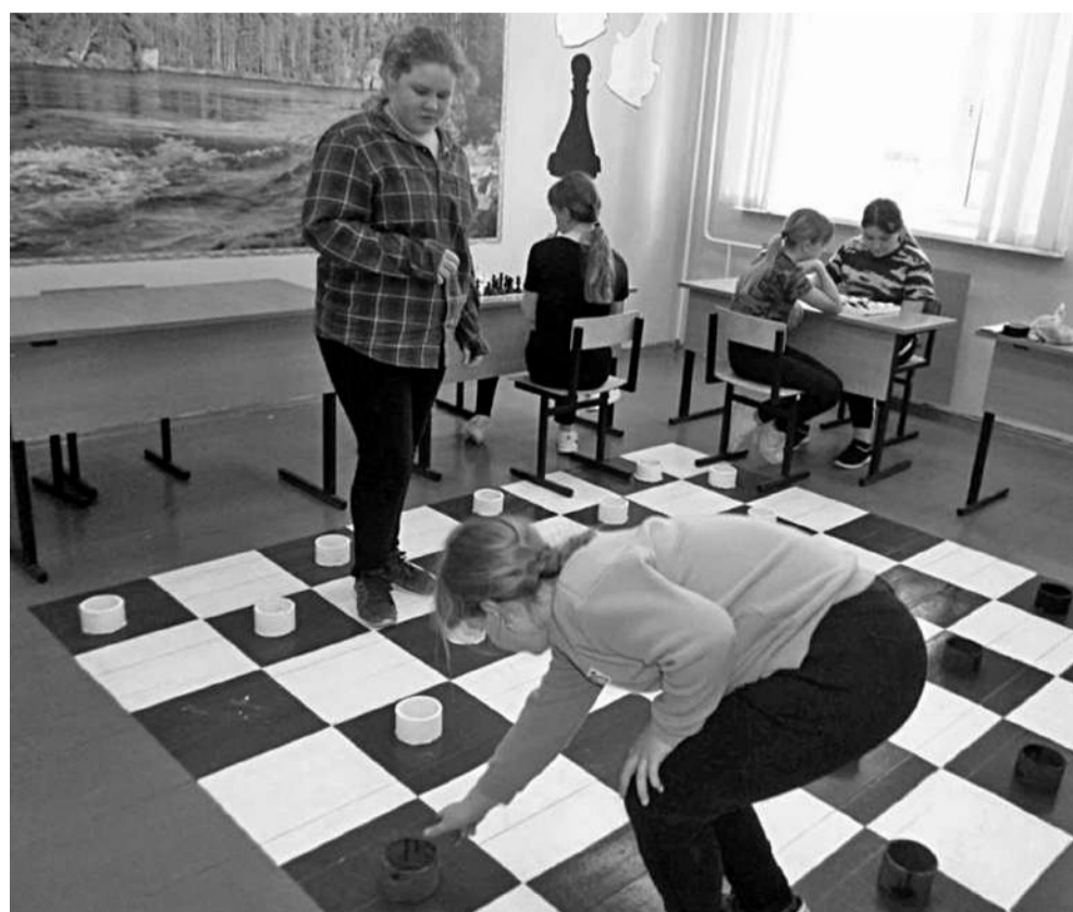
Игровая зона в Глинской школе