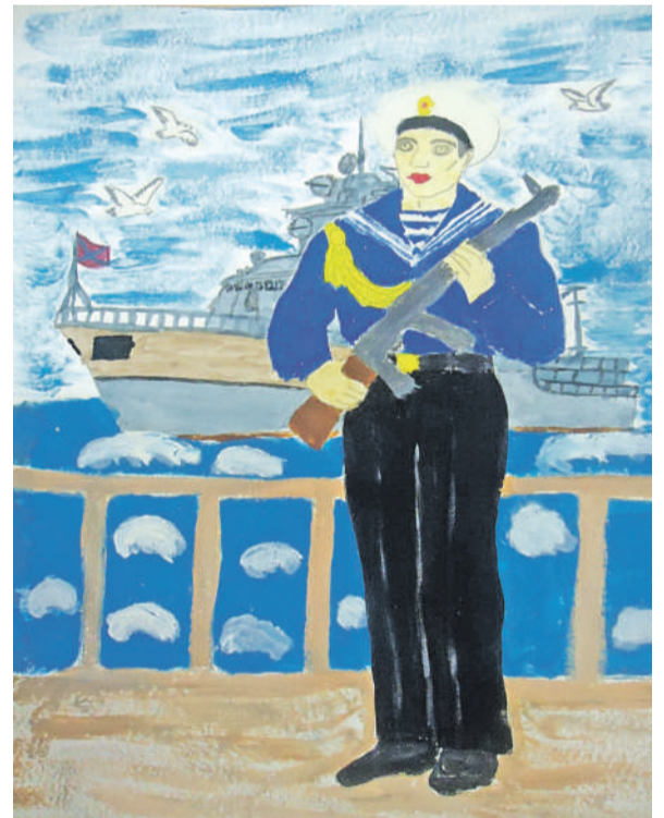
Моряк. Рисунок Анатолия Черняева (Графовская школа Шебекинского горокруга)

Ульяна Самаль, ученица Бессоновской школы Белгородского района