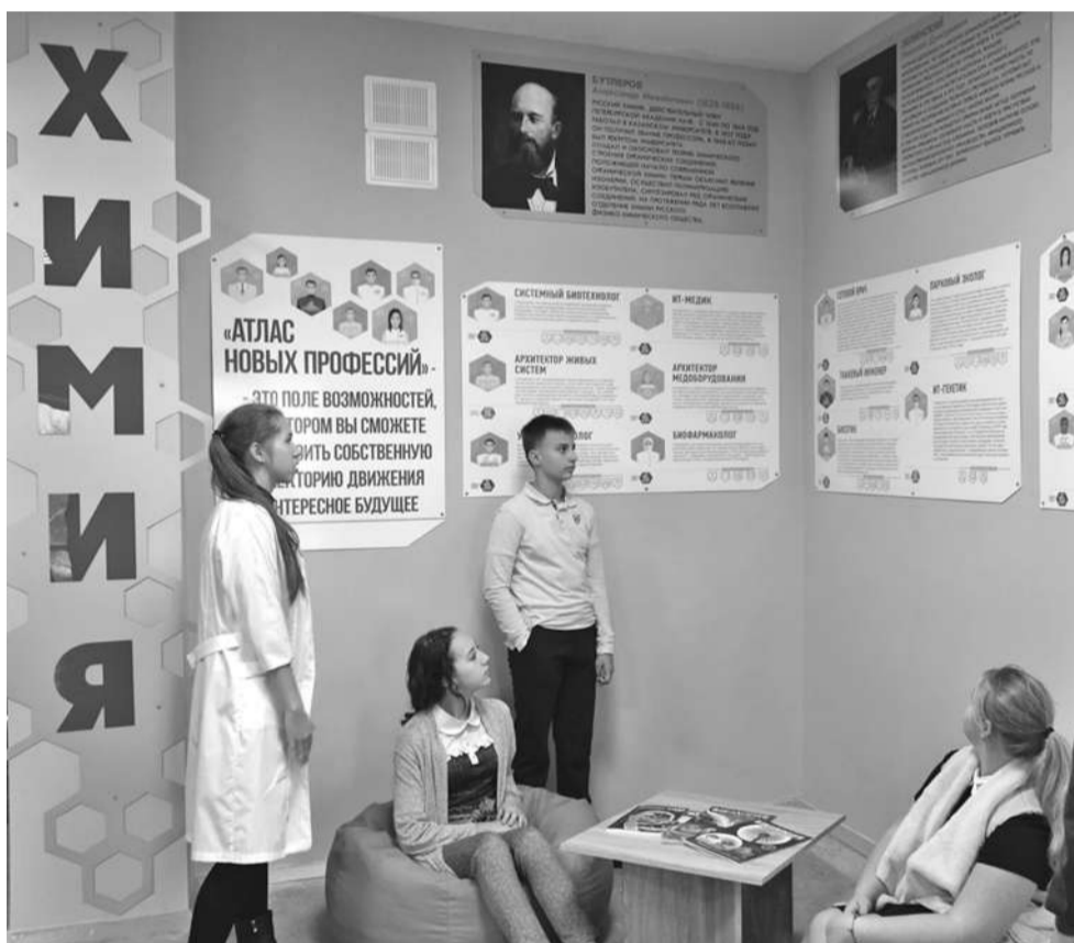
Профориентационная зона в школе № 1