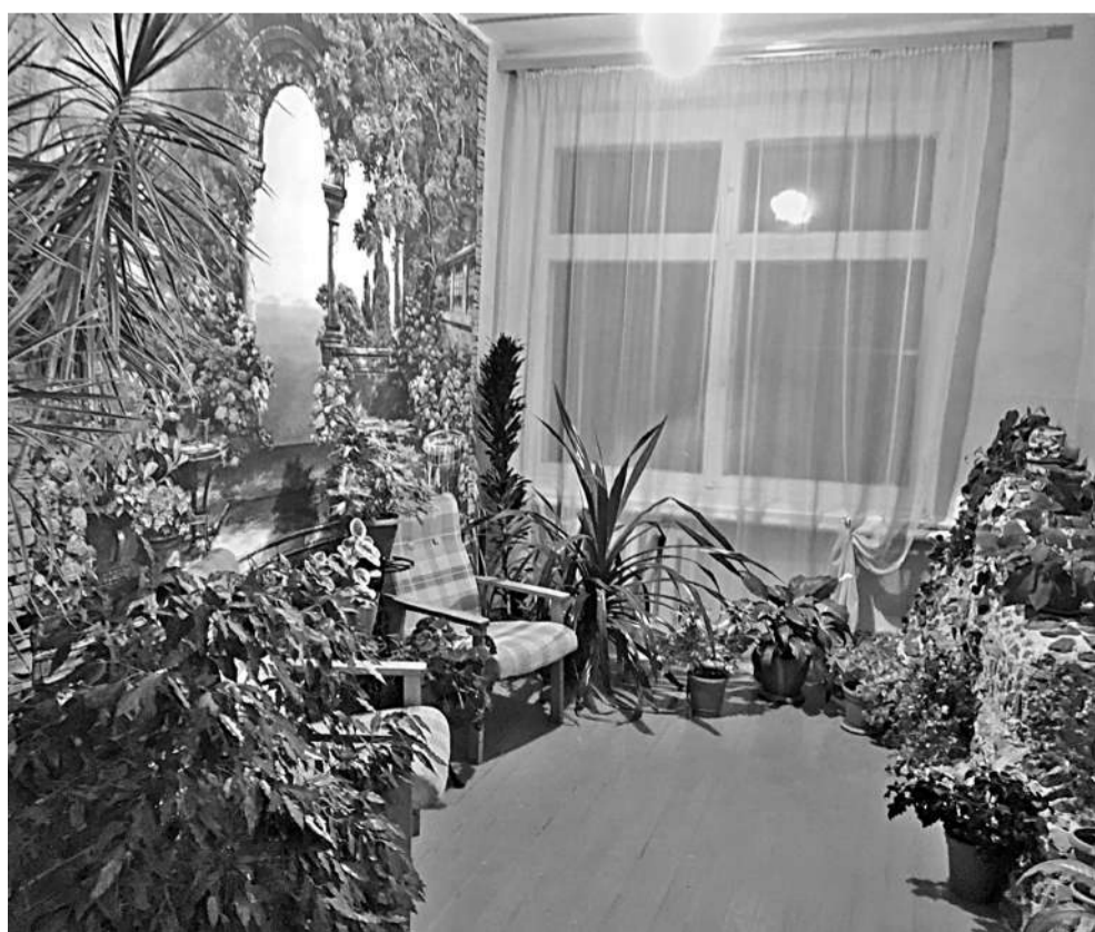
Зимний сад в Васильдольской школе